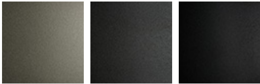
GFM11 titan gaufriert