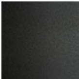
GFM69 graphit gaufriert