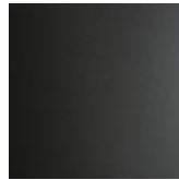
OP69 matt graphite