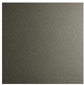
GFM11 titan gaufriert