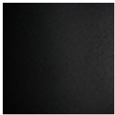
GF73 schwarz gaufriert