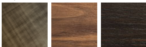
brushed bronze NC nussbaum canaletto RB verbrannte eiche