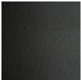
GFM69 graphit gaufriert