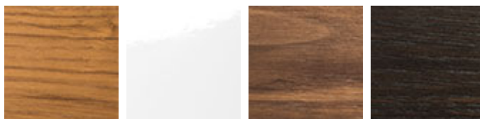
HR Eiche Heritage