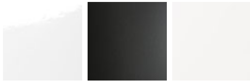
L7 weiß glaenzend lackiert