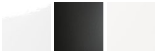
L7 weiß glaenzend lackiert