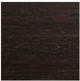
frRB Esche gebeiz "verbrannte Eiche"