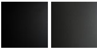
OP17 matt schwarz