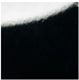
L3 schwarz glaenzend lackiert