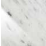
BC weiß Carrara