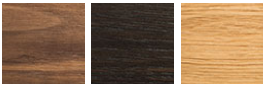
NC nussbaum canaletto