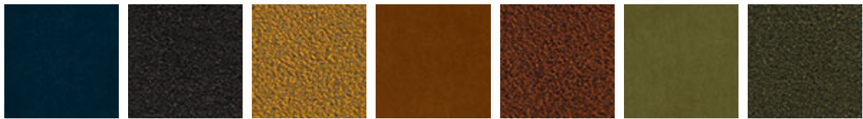
B929 B246 B247 B930 B248 B931 B249