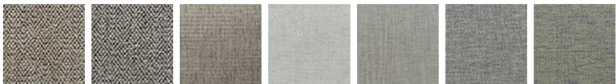
B720 B722 B403 B420 B521 B710 B711