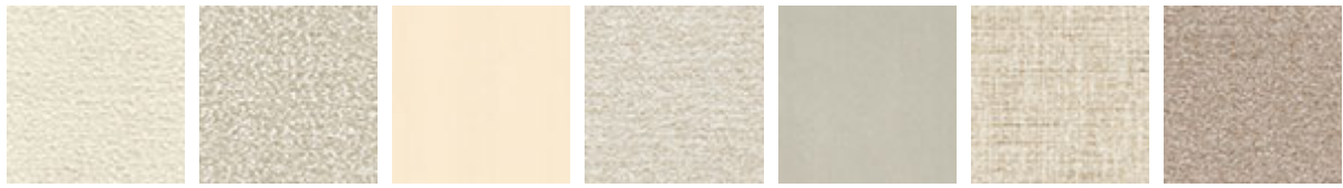
B240 B241 B920 B730 B921 B610 B732