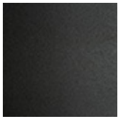
GFM69 graphit gaufriert