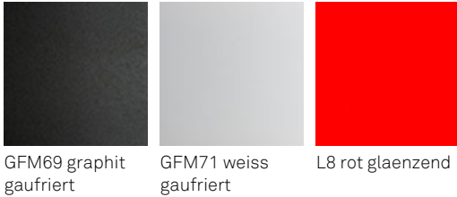
GFM69 graphit gaufriert