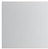
GFM71 weiss gaufriert