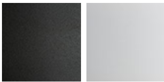
GFM69 graphit gaufriert