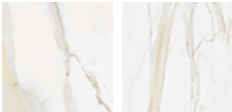
KM05 matt Golden Calacatta