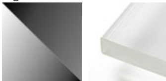
extra hell graphit