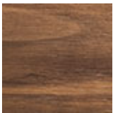
NC nogal canaletto