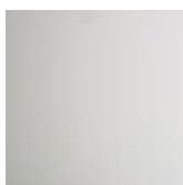
OP71 blanco mate