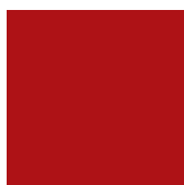
OP89 rojo corsa