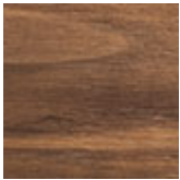
NC nogal canaletto