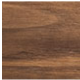
NC nogal canaletto