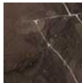
EBO Ebanó mate