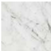
BCO blanco Carrara mate