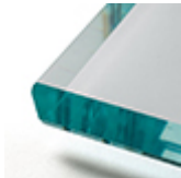
transparente extraclaro biselado