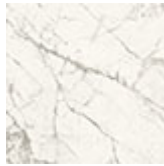
KM24 Invisible mate