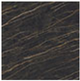
KM07 Portoro mate