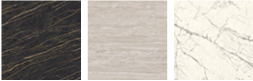
KM07 Portoro mate