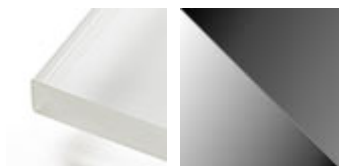
blanco extra claro