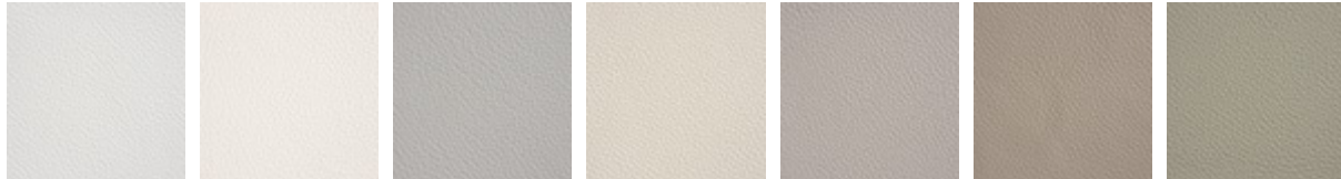
971 BIANCO 937 PALLADIO 972 CANOVA 947 OYSTER 959 ICE 939 NYMPH 949 CENERE