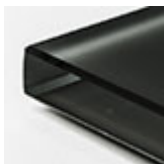
verre extraclair verni noir acide