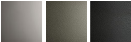
acier inox poli