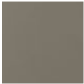
GF30 gaufré grey