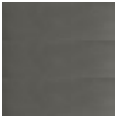
OP0 verni transparent