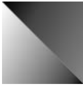
iron grey satiné