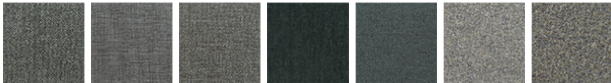
B540 B522 B541 B531 B421 B220 B221