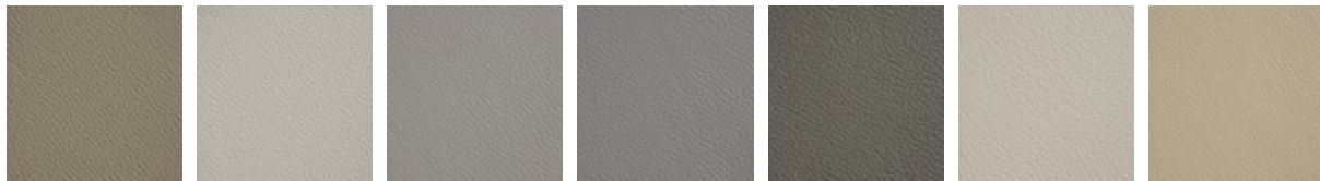
951 CASTORO 993 ARTICO 938 DAKOTA 995 NARDÒ 983 ARGILLA 948 LINO 969 CASHMERE