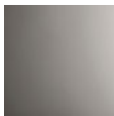
acier inox poli