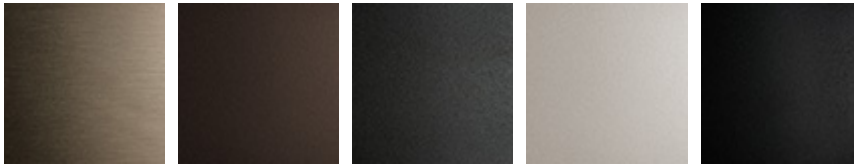
11 titane satiné