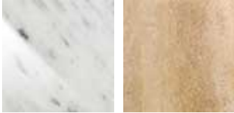
BC blanc Carrara brillant TN Travertin