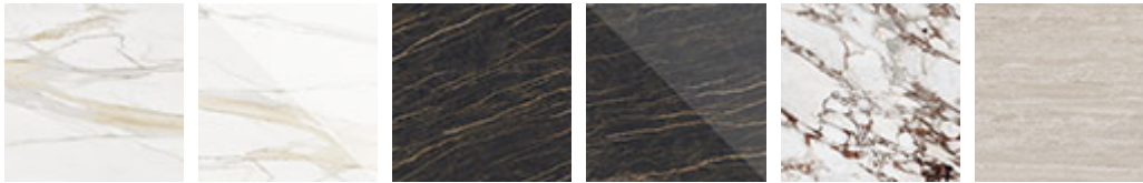
KM05 Golden Calacatta opaque