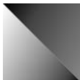
iron grey satiné