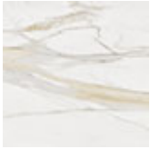
KM05 Golden Calacatta opaque