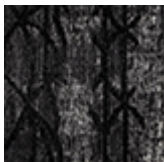
chenille du coton Mumbai