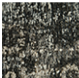
chenille du coton Mapoon