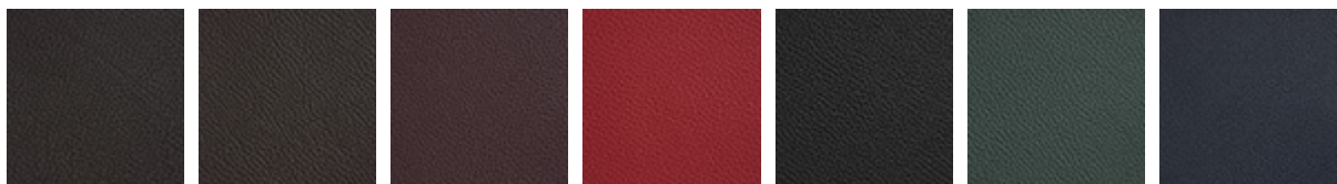
943 MOKA 891 TESTA DI MORO 944 BORDEAUX 989 ROSSO CORSA 973 NERO 987 SHERWOOD 940 NAVY