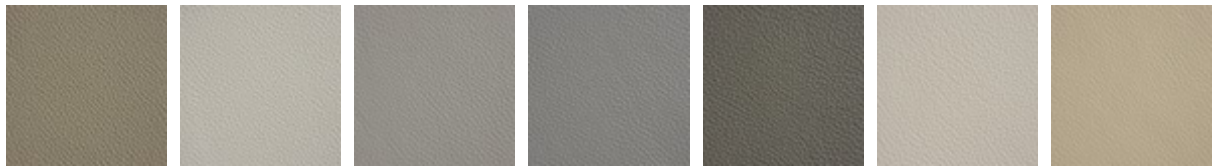
951 CASTORO 993 ARTICO 938 DAKOTA 995 NARDÒ 983 ARGILLA 948 LINO 969 CASHMERE