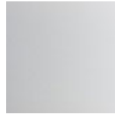
GFM71 goffrato bianco