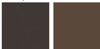
LM21 grigio Londra Fenix