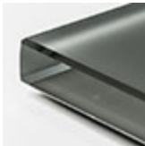
graphite extra chiaro acidato