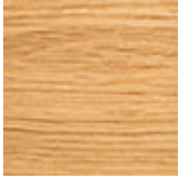
RN rovere naturale