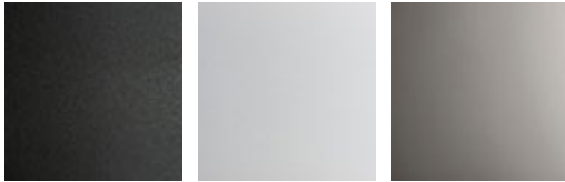
GFM69 goffrato graphite