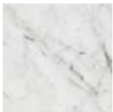
BCO bianco Carrara opaco