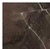
EBO Ebanò opaco