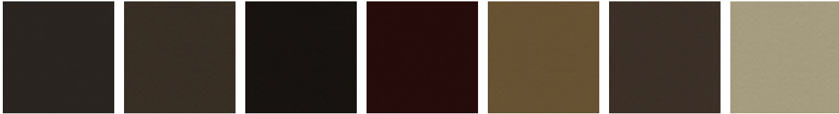
891 TESTA DI MORO